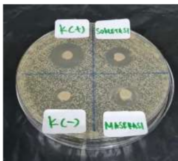
Gambar 2. Hasil perlakuan sampel pada media agar

Secara deskriptif Tabel 2 menggambarkan bahwa zona hambat pertumbuhan bakteri Staphylococcus aureus paling tinggi pada kelompok kontrol positif dengan nilai rata-rata sebesar 20,38. Pada metode maserasi nilai rata-rata sebesar 13,29, pada metode sokletasi nilai rata-rata sebesar 15,67 dimana lebih besar dibandingkan dengan rata-rata pada metode maserasi.