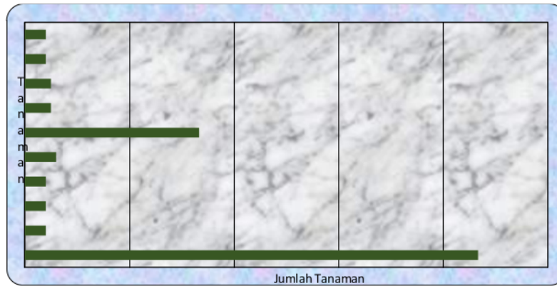
Gambar 2. Rerata jenis tanaman yang dibudidayakan dalam luas 100 m 2 di desa Pajahan