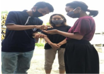
Gambar 4. Edukasi penggunaan handsanitizer

Penggunaan handsanitizer merupakan salah satu upaya pencegahan covid-19. Ditengah pandemi covid-19, handsanitizer sangat diperlukan jika masyarakat akan bepergian.