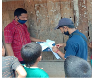
Gambar 2. Pembagian dan penempelan poster

poster terutama dilakukan di tempat-tempat umum, seperti kantor desa dan juga warung-warung warga.