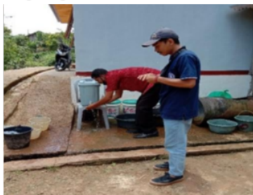
Gambar. 5 Edukasi mencuci tangan

Mencuci tangan adalah salah satu tindakan sanitasi dengan membersihkan tangan untuk menjadi bersih dan memutus mata rantai kuman. Hal ini dikarenakan tangan seringkali menjadi agen pembawa kuman dan virus berpindah dari satu orang ke orang lain baik dengan kontak langsung maupun kontak tidak langsung.