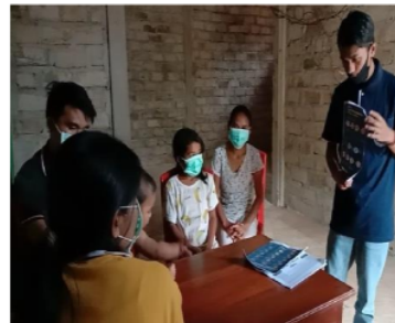
Gambar 6. Penyuluhan dan sosialisasi kepada masyarakat

Pelaksanaan edukasi kepada masyarakat juga dilakukan dengan penyuluhan/sosialisai secara langsung kepada masyarakat dalam kelompok kecil. Kegiatan ini ini dilaksanakan di rumah warga Desa Pong Umpu dengan tetap menerapkan protokol kesehatan. Edukasi berisi materi tentang awal kasus covid-19, bahaya, gejala hingga cara pencegahan penyebaran covid-19.