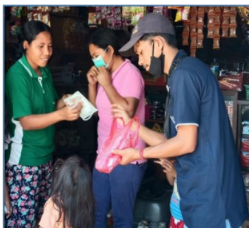
Gambar 7. Penyaluran masker kepada masyarakat