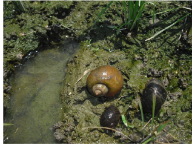
Gambar 3. Hama keong mas tanaman padi

Hama yang paling sering merugikan petani adalah serangan hama tikus, namun hama ini dapat ditanggulangi petani dengan baik, dan akhir-akhir ini ada hama baru yang sering menyerang tanaman padi adalah keong mas seperti nampak pada Gambar 3. Hasil diskusi menemukan untuk menanggulangi serangan hama keong mas, dapat dilakukan secara konvensional dengan menangkap secara langsung selanjutnya dimanfaatkan untuk pakan itik.