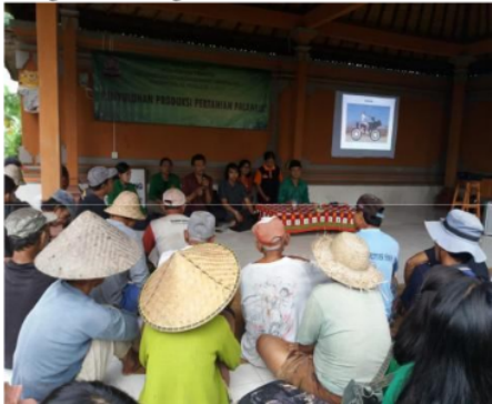
Gambar 2. Penyuluhan Sistem Tanam Padi Jajar Legowo

Penyuluhan sistem tanam padi jajar legowo dilaksanakan di Balai Subak Paang dengan melibatkan 20 orang petani dihadiri oleh ketua subak (pekaseh) utusan dari pegawai kelurahan, seperti tampak pada Gambar 2. Pada kegiatan penyuluhan terungkap produktivitas usahatani padi dari tahun ke tahun mengalami stagnan tidak pernah lebih dari 5 ton/hektar dan itupun kalau panen lagi baik, tidak ada gangguan hama dan penyakit tanaman, dan petani menyampaikan bahwa panen padinya sering mengalami kerugian.