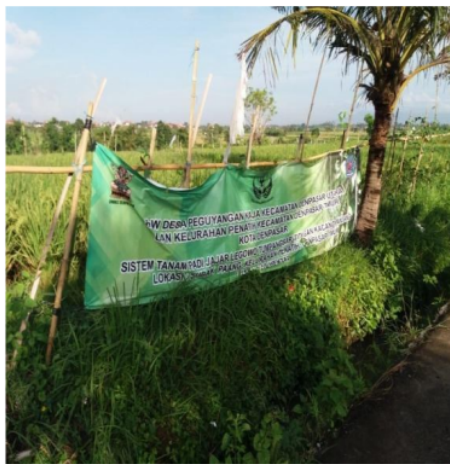
Gambar 4. Penampilan padi dan kacang panjang di pematang sawah.

Biaya-biaya yang dikeluarkan petani dalam mengelola usahatani meliputi biaya pembelian, benih pupuk dan pestisida, biaya peralatan produksi serta upah tenaga kerja. Untuk mengetahui rata-rata pendapatan yang diterima oleh para petani sebelum dan setelah menerapkan teknologi sistem tanam jajar legowo dapat dilihat pada Tabel dibawah ini.